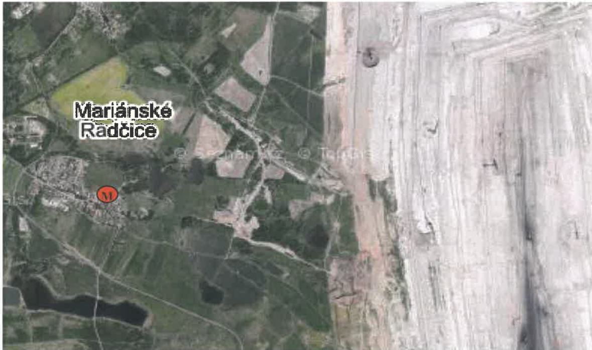
Obr. 1 Poloha měřicího místa v lokalitě – letecký snímek